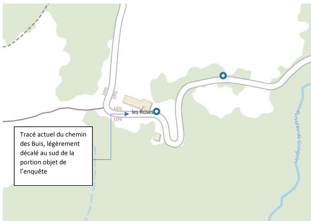
4. IGN Cartographie routière actuelle

De plus, les images fournies par « IGN Remonter le temps » pour la période 1965-1980 (photo 5 ci-dessous) confirme également que cette situation existe depuis de nombreuses années (au moins 45 ans).