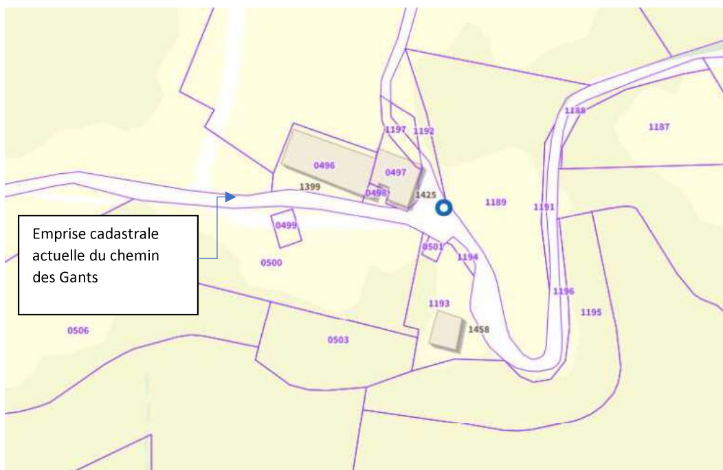
3. IGN - Cadastre en vigueur

L'analyse comparative du cadastre en vigueur (image 3) avec la cartographie routière IGN (image 4) confirme cette distorsion de fait et montre, comme sur le terrain, que la continuité du cheminement pour le public est assurée par le nouveau tracé de la route des Buis, rendant inutile, et inutilisé, la partie objet de l'enquête.