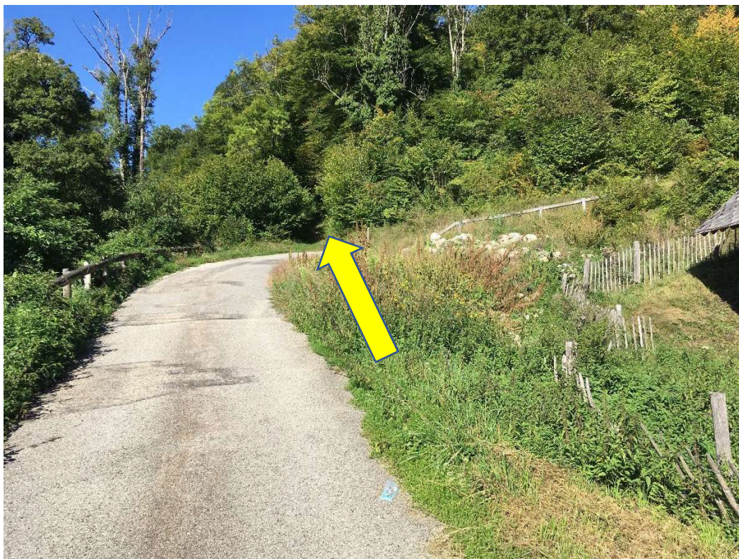
2 : Antérieurement, le cheminement se prolongeait sur la partie haute (flèche)

L'analyse comparative du cadastre en vigueur (image 3) avec la cartographie routière IGN (image 4) confirme cette distorsion de fait et montre, comme sur le terrain, que la continuité du cheminement pour le public est assurée par le nouveau tracé de la route des Buis, rendant inutile, et inutilisé, la partie objet de l'enquête.