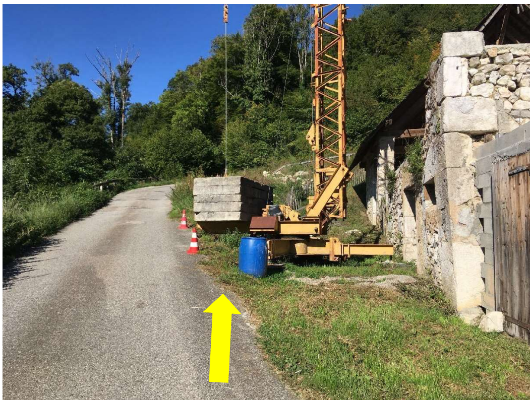
1 : La portion de l'ancien chemin rural concernée par l'enquête chevauche le talus droit de la route des Buis et la partie gauche de l'emplacement de la grue...

3. Visite sur le terrain : Ma visite sur place confirme d'évidence le bienfondé de cette analyse. Ladite partie de chemin rural a effectivement été remplacée depuis bon nombre d'années (plus de 45 ans selon la cartographie et les photographies IGN ci-après) par un nouveau tracé, devenu route des Buis, (partie enrobée, à gauche sur les photos ci-dessous), lequel tracé, virant sur la droite au-dessus du bâtiment, s'est traduit, lors de sa construction, par l'établissement d'un haut talus, court-circuitant, de fait, le tracé de l'ancien chemin rural. Ainsi, cette partie du chemin rural des Gants, devenue inutilisable pour la circulation publique, a été remplacée par le nouveau tracé de la route des buis précitée. Dans ces conditions, la portion de l'ancien tracé objet du projet d'aliénation n'est effectivement utile qu'au seul propriétaire du bâtiment riverain pour accéder à son bien, et non au public.